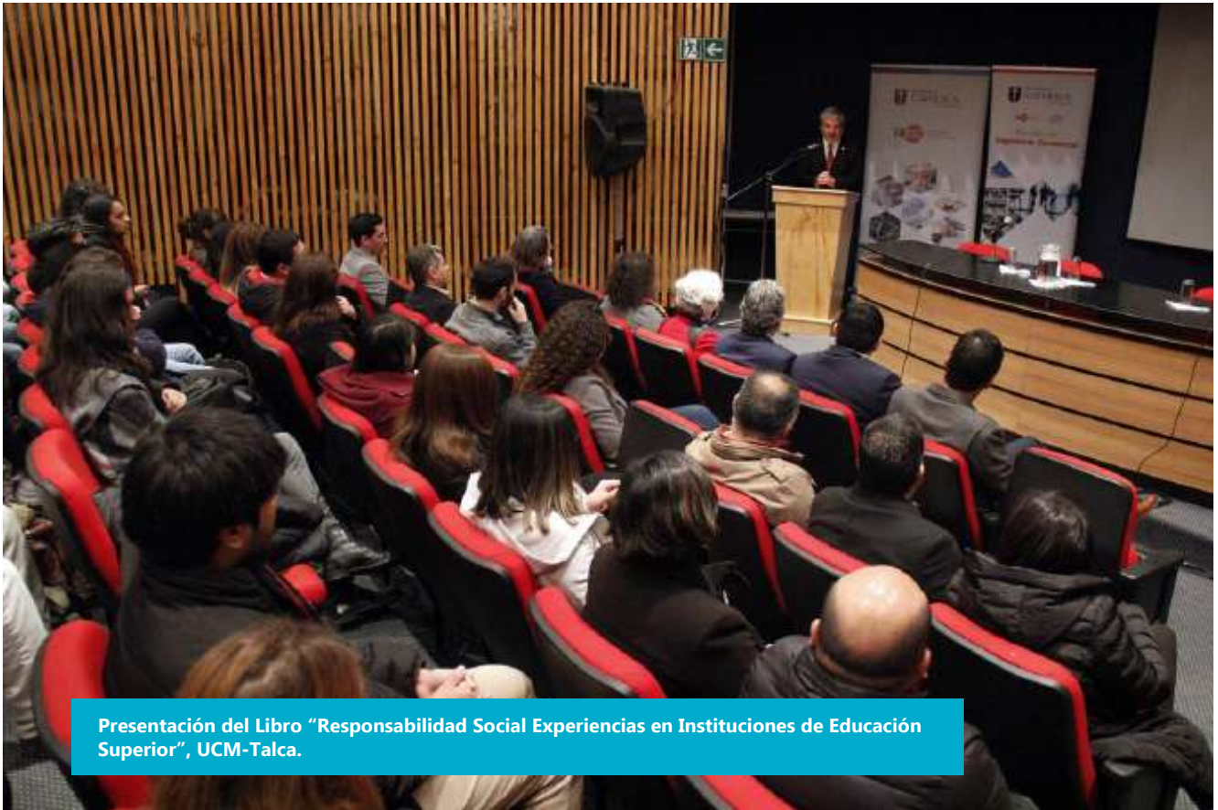
Presentación del Libro "Responsabilidad Social Experiencias en Instituciones de Educación Superior", UCM-Talca.