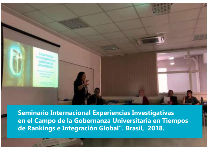
Seminario Internacional Experiencias Investigativas en el Campo de la Gobernanza Universitaria en Tiempos de Rankings e Integración Global". Brasil, 2018.