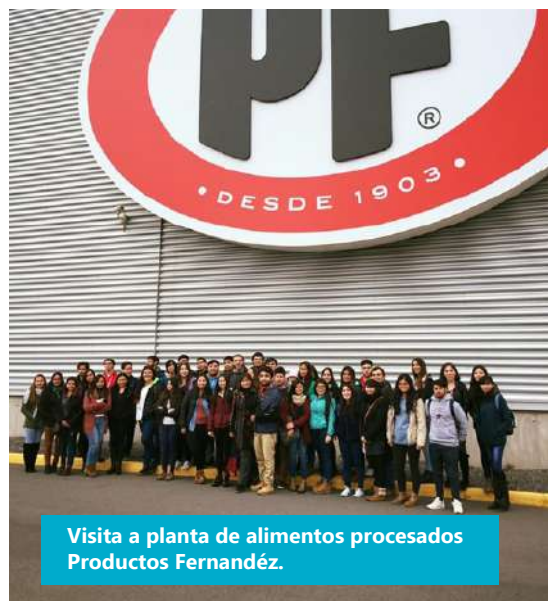
Visita a planta de alimentos procesados Productos Fernández.