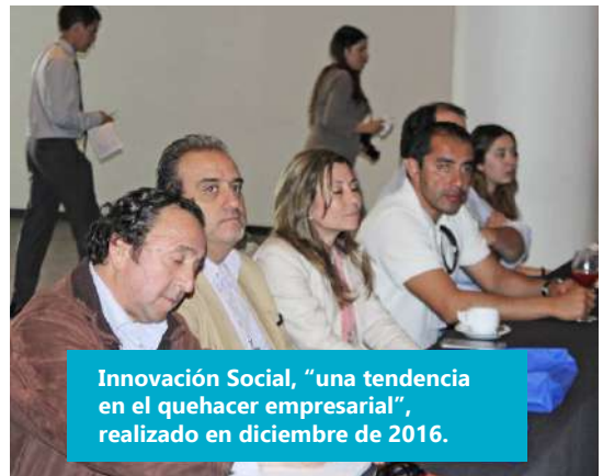
Innovación Social, "una tendencia en el quehacer empresarial", realizado en diciembre de 2016.