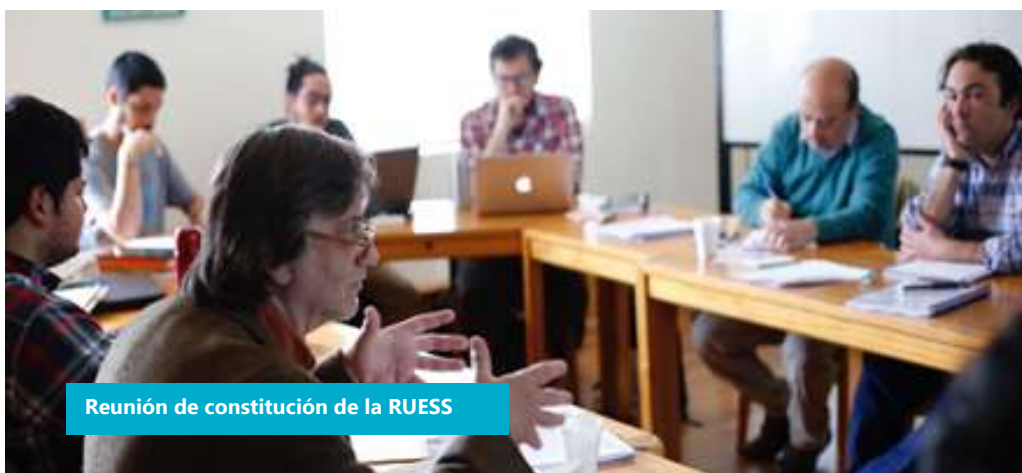
Reunión de constitución de la RUESS