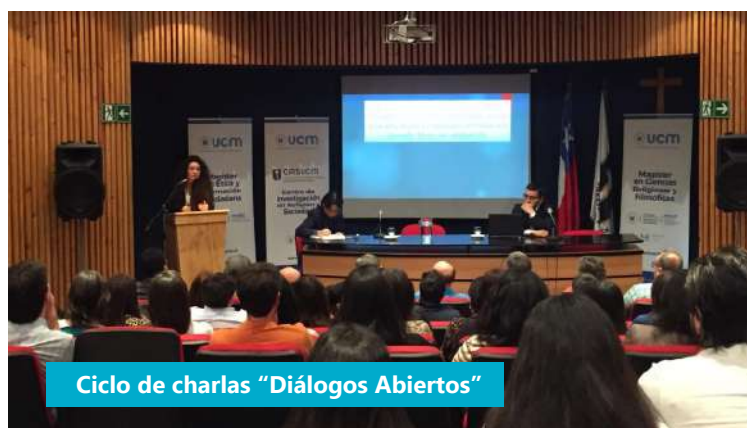
Ciclo de charlas “Diálogos Abiertos”