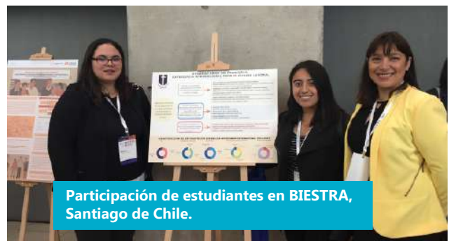
Participación de estudiantes en BIESTRA, Santiago de Chile.