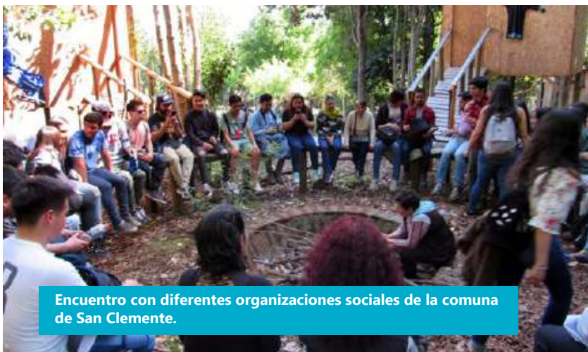
Encuentro con diferentes organizaciones sociales de la comuna de San Clemente.