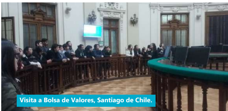
Visita a Bolsa de Valores, Santiago de Chile.