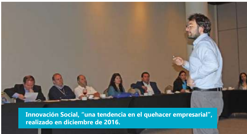
Innovación Social, "una tendencia en el quehacer empresarial", realizado en diciembre de 2016.

Además, algunas asignaturas en la carrera realizan visitas a terreno a empresas de la región (PF, COEXCA S.A., Viña Balduzzi, Agrícola San Clemente) y a organismos relevantes para la carrera (Bolsa de Comercio). Lo anterior, con la intención de que nuestros estudiantes conozcan de primera mano procesos productivos y logren un acercamiento directo con el medio relacionado a las organizaciones de distinta naturaleza. Las visitas a terreno también han permitido la participación de nuestros estudiantes en congresos nacionales realizados fuera de la región.