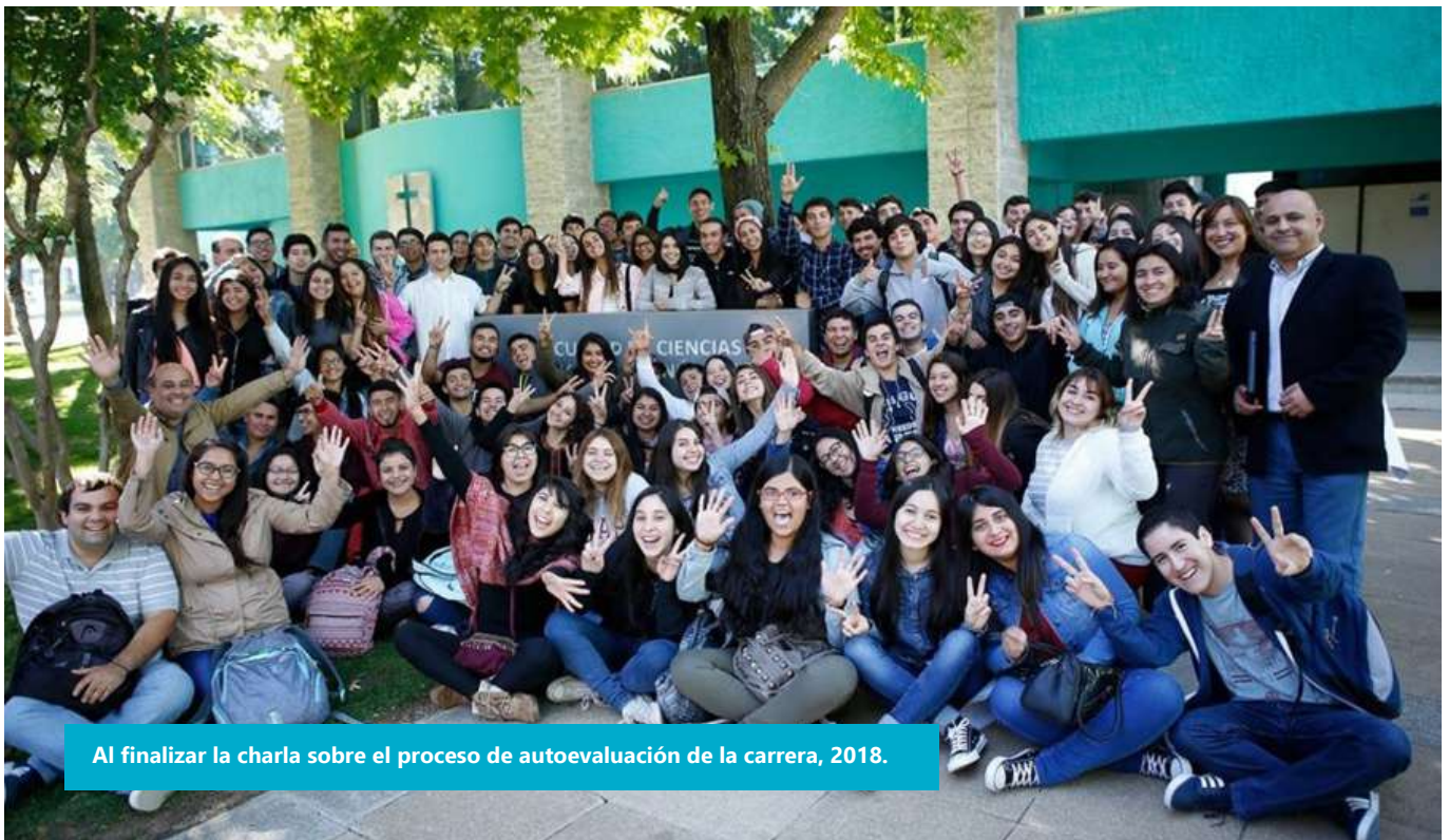
Al finalizar la charla sobre el proceso de autoevaluación de la carrera, 2018.

Desde el inicio del proceso de autoevaluación se ha fomentado la amplia participación de parte de los actores claves, con lo cual se ha logrado el involucramiento efectivo de parte de estudiantes, egresados, docentes y empleadores.