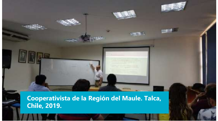
Cooperativista de la Región del Maule. Talca, Chile, 2019.