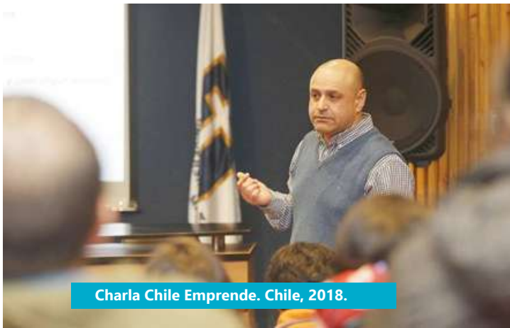
Charla Chile Emprende. Chile, 2018.