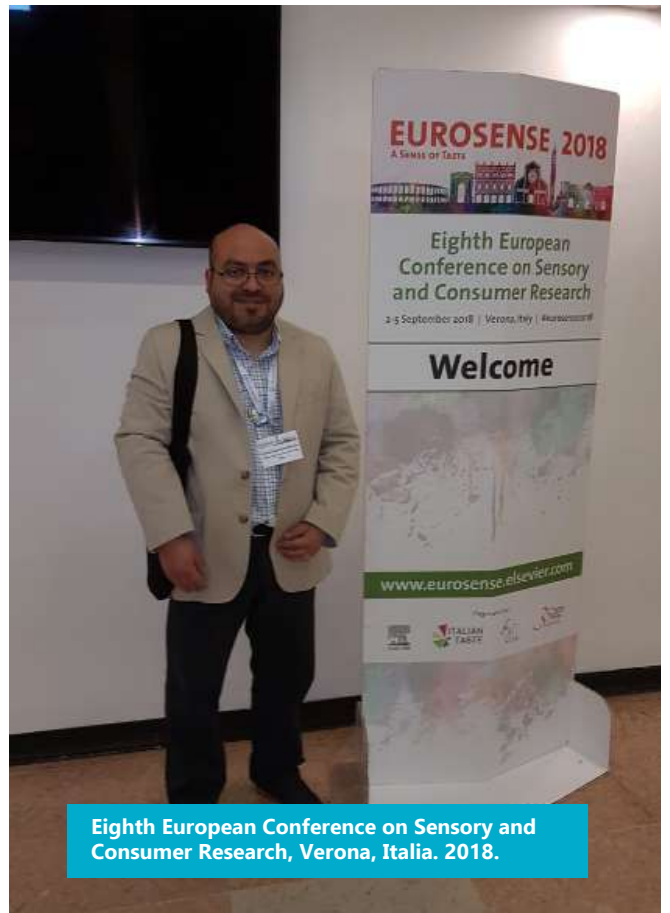
Eighth European Conference on Sensory and Consumer Research, Verona, Italia. 2018.