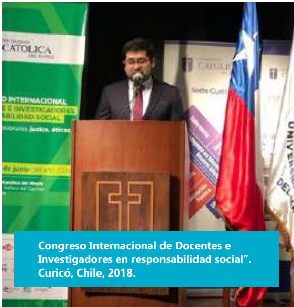
Congreso Internacional de Docentes e Investigadores en responsabilidad social". Curicó, Chile, 2018.