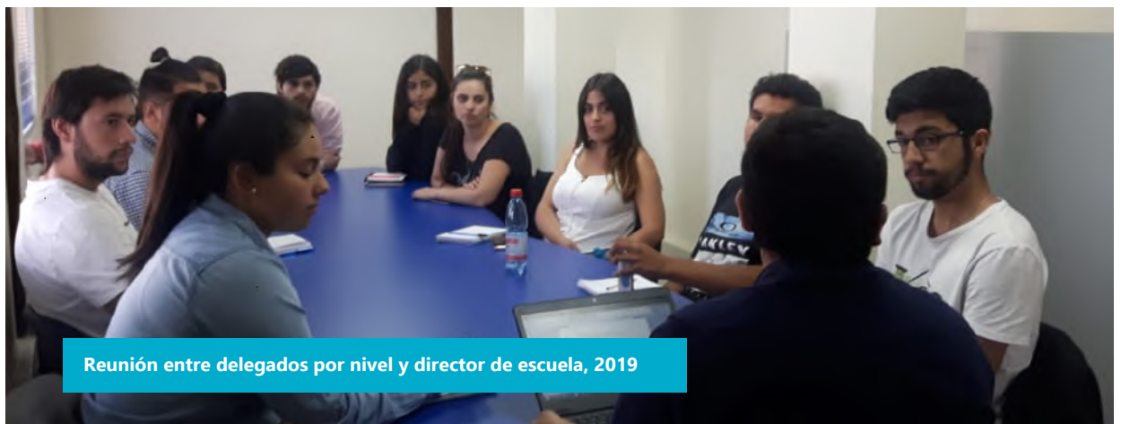
Reunión entre delegados por nivel y director de escuela, 2019