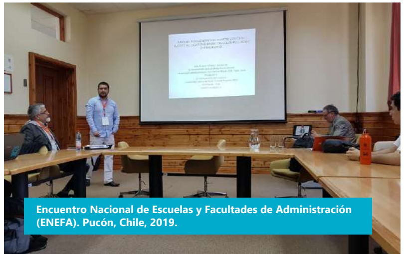
Encuentro Nacional de Escuelas y Facultades de Administración (ENEFA). Pucón, Chile, 2019.