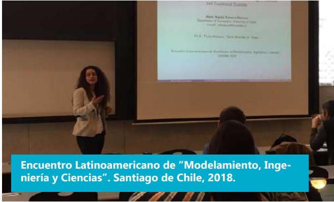
Encuentro Latinoamericano de "Modelamiento, Ingeniería y Ciencias". Santiago de Chile, 2018.