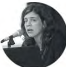
Tania de Armas