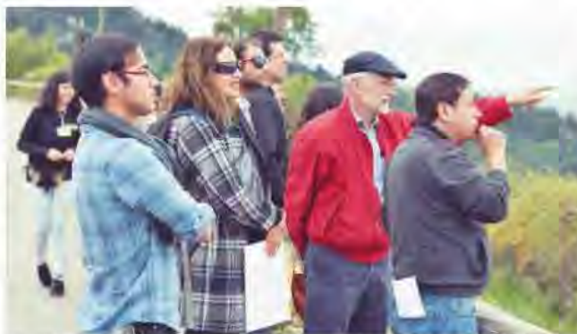
Recorridos por diversos puntos de la ciudad permitieron que los participantes conocieran las diferentes realidades de Talca.