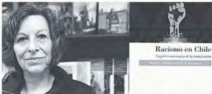
"Racismo en Chile. La piel como marca de la inmigración", de la Editorial Universitaria, se presentó en Talca el miércoles pasado en el contexto del 9º Congreso de Sociología.