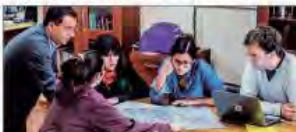
Un momento de la presentación del libro 'El centro del debate en ciencias sociales' en Talca.

El evento se organiza por la Facultad de Ciencias Sociales y Económicas de la UCM en conjunto con Sociored. El evento se organiza por la Facultad de Ciencias Sociales y Económicas de la UCM en conjunto con Sociored.