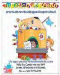
Una feria para los niños de Talca en la Villa Los Condos en mayo 2014.

El evento se organiza por la Facultad de Ciencias Sociales y Económicas de la UCM en conjunto con Sociored.