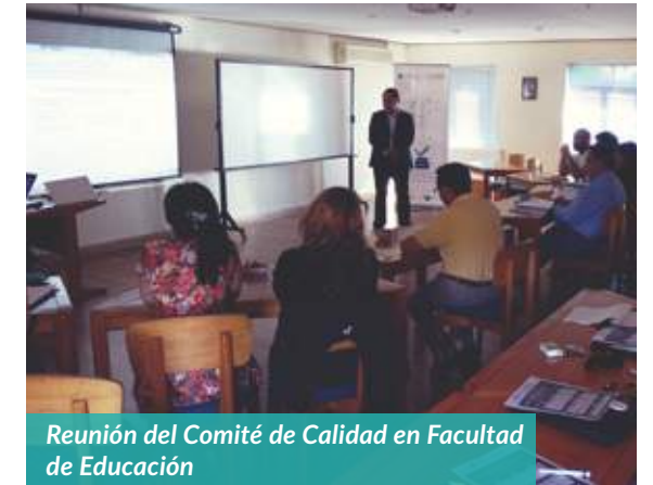
Reunión del Comité de Calidad en Facultad de Educación