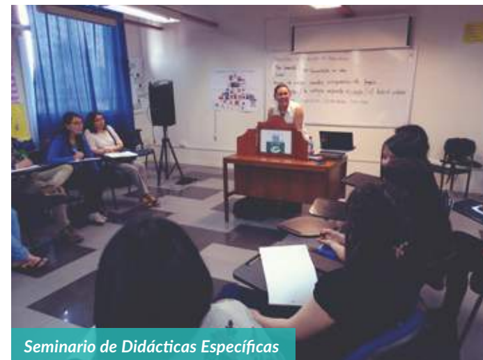
Seminario de Didácticas Específicas