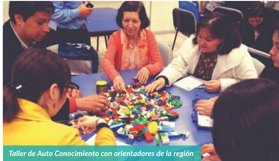
Taller de Auto Conocimiento con orientadores de la región