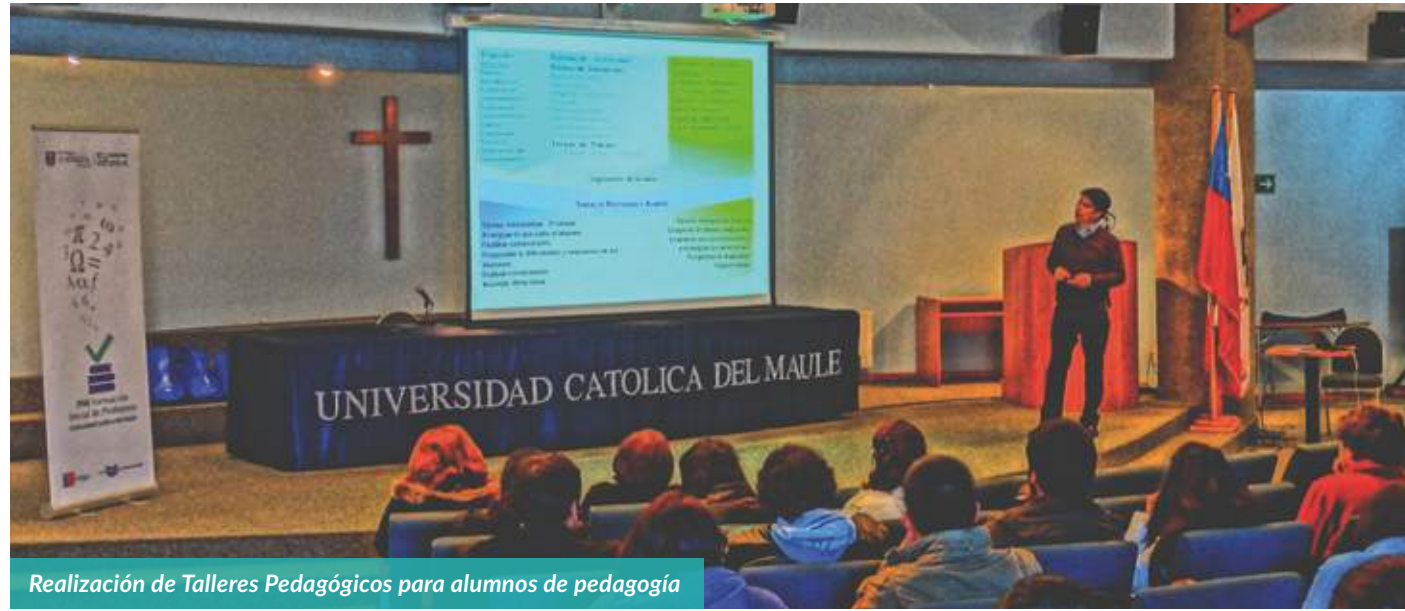
Realización de Talleres Pedagógicos para alumnos de pedagogía