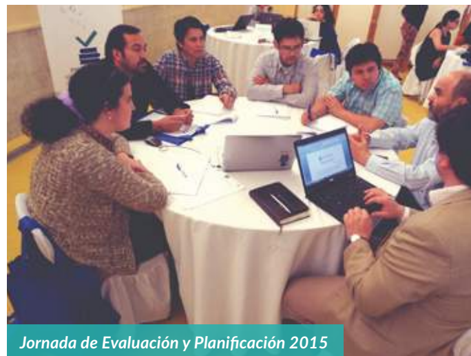
Jornada de Evaluación y Planificación 2015