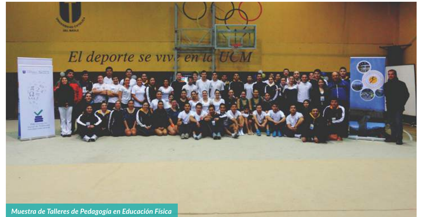
Muestra de Talleres de Pedagogía en Educación Física