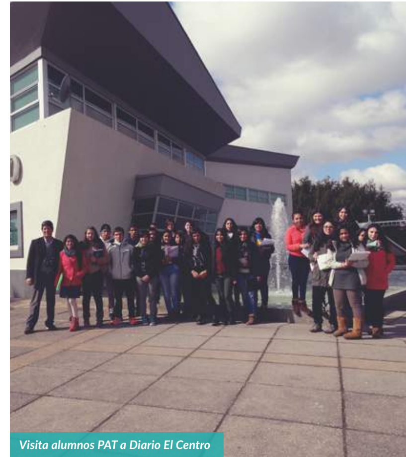
Visita alumnos PAT a Diario El Centro