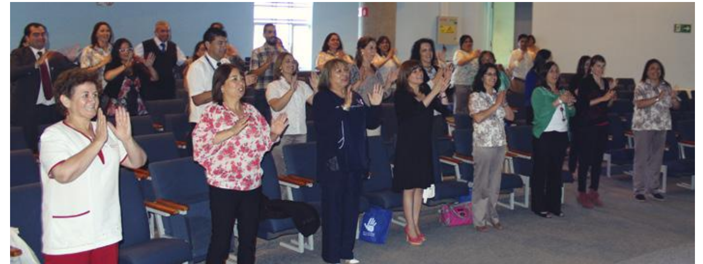
Dinámicas y talleres teóricos fueron parte de la jornada.