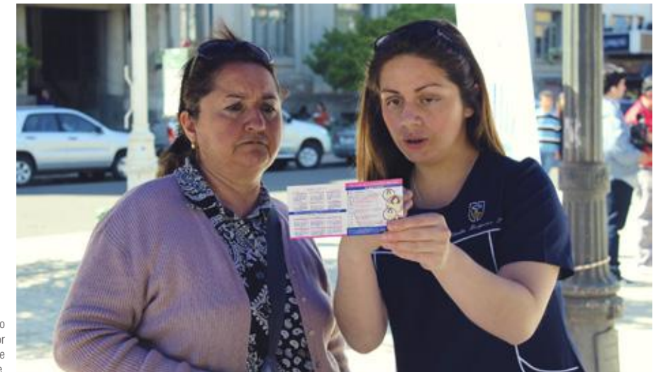
Prevención en cáncer cervico uterino, presentado por académica de la Escuela de Enfermería UC del Maule.