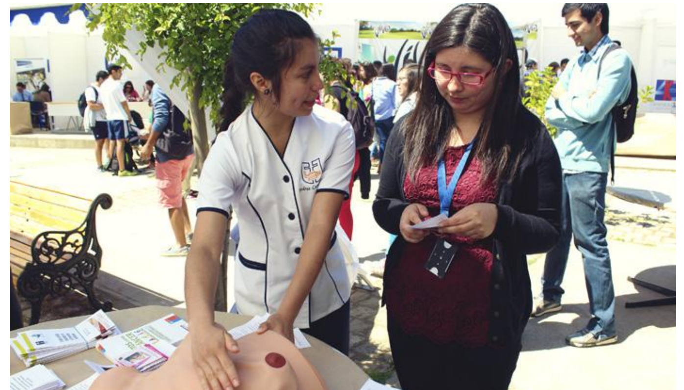
Alumna de la Escuela de Enfermería, entregando conocimientos prácticos del autoexamen de mamas.