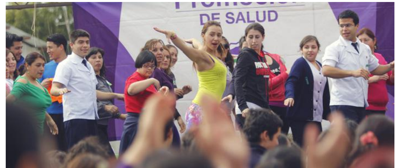
En agosto del año 2014, el PMI en Oncología participa en el lanzamiento del Plan Comunal de Promoción de Salud de San Clemente.