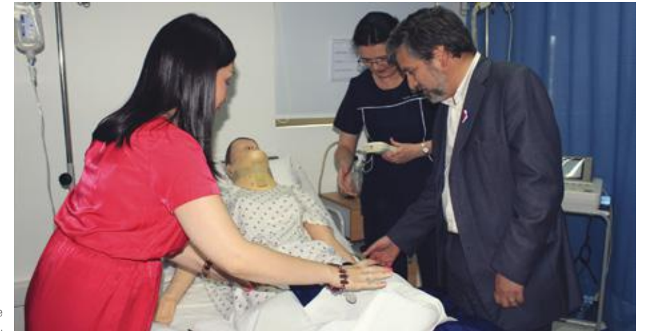
Visita al centro de simulación de la Escuela de Enfermería.