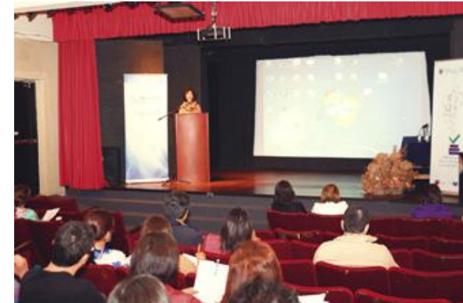
Saludo Inicial Directora de Escuela de Pedagogía en Educación General Básica con mención.