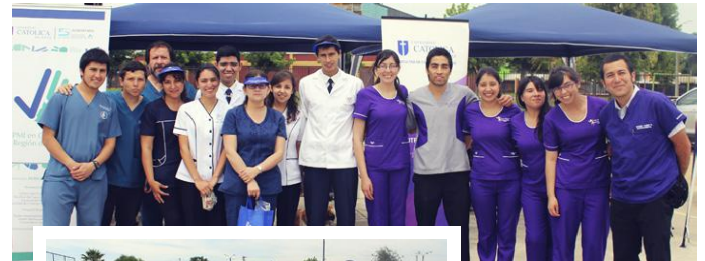
Académicos y alumnos de las escuelas de Nutrición y Dietética, Kinesiología y Enfermería de la UC del Maule.