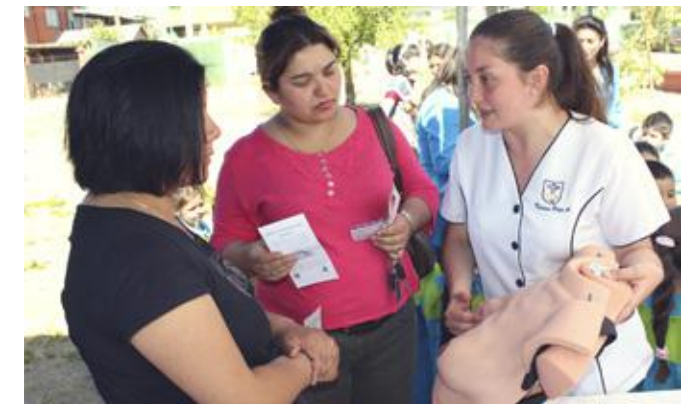
Alumna de la Escuela de enfermería muestra técnicas para realizarse el autoexamen de mamas.