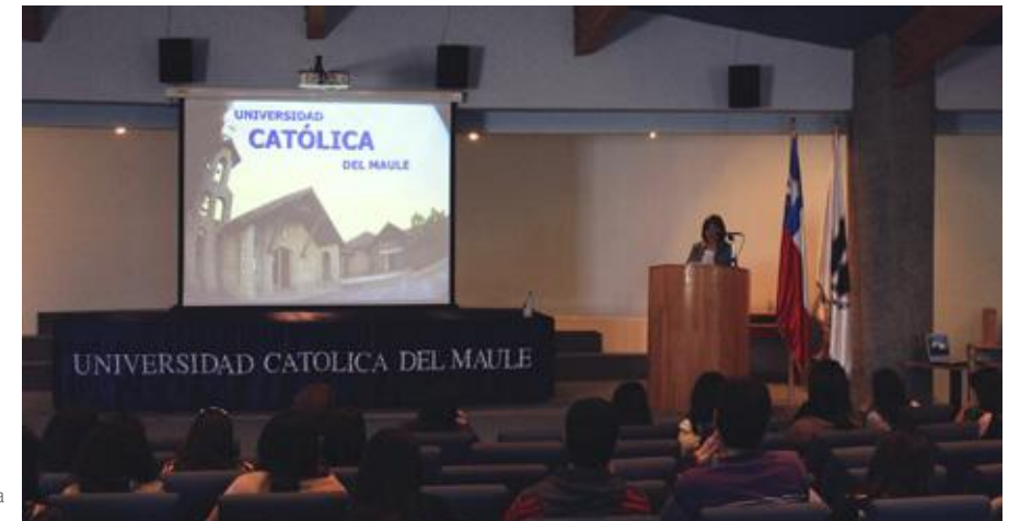
Jornada de Investigación para estudiantes de Enfermería.