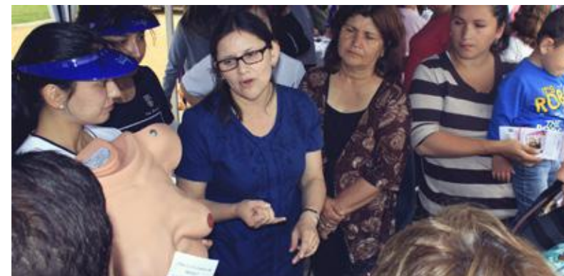
Académica de la Escuela de Enfermería, en charla de sensibilización para la prevención del cáncer de mamas.