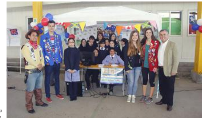
Director de la Escuela, junto a visitantes extranjeras.