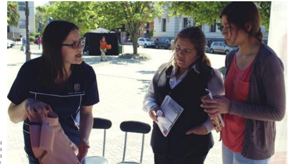
En plaza de armas de Talca se conmemoró la Semana mundial de la lucha contra el cáncer.