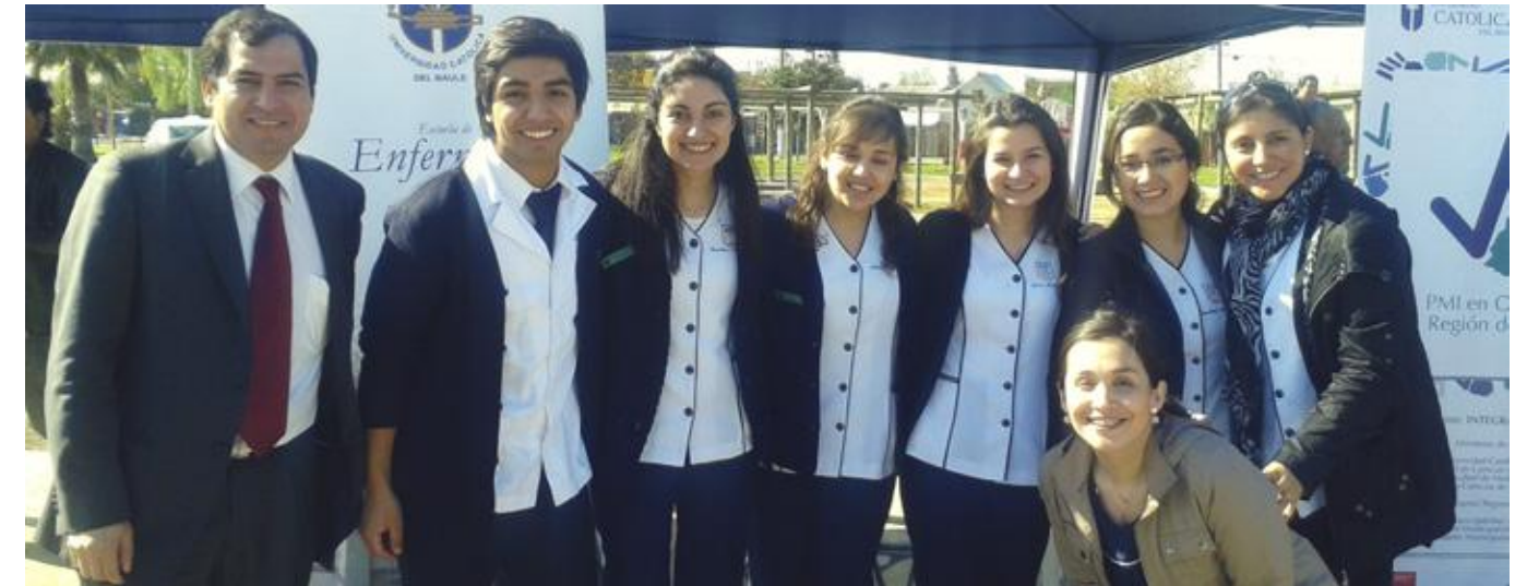
Académicos y alumnos de la Escuela de Enfermería Talca, comprometidos con una presencia permanente en las actividades desarrolladas por el PMI en Oncología.