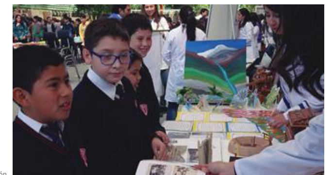
Stand de la exposición