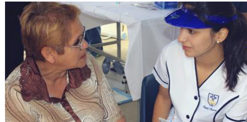
La prevención y diagnóstico precoz en cáncer como ejes estratégicos del PMI en Oncología en cada una de sus actividades comunitarias.