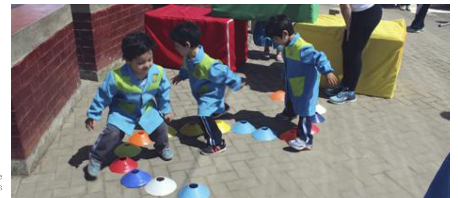
A través de juegos de psicomotricidad los más pequeños aprenden conductas saludables.