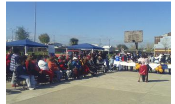
Adultos mayores reunidos en actividad "Pasé agosto" organizado por el CESFAM Las Américas.