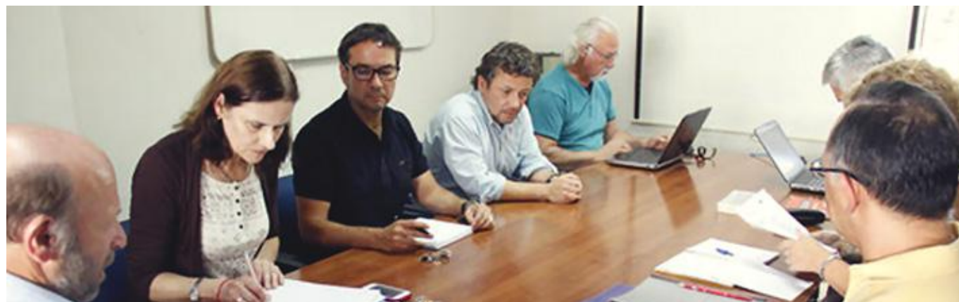
Socialización sistema de datos SIDI

Fortalecer los procesos de gestión que permitan apoyar los procesos formativos de calidad en la formación de profesores y promover tasas de titulación oportuna de nuevos pedagogos.