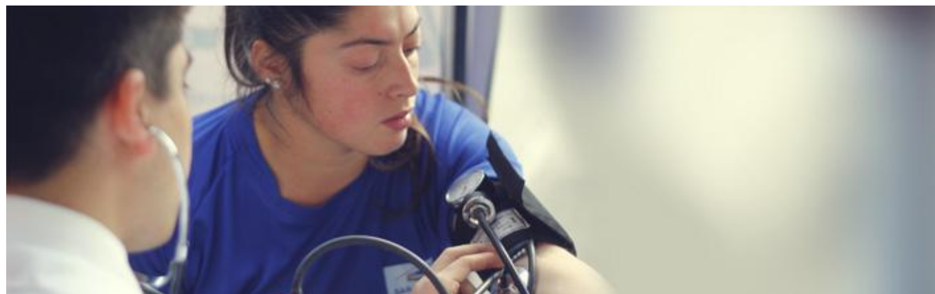
El examen de medicina preventiva pesquisado por alumnos de la Escuela de Enfermería de la UC del Maule.

Contribuir a la formación, permanencia y atracción del capital humano especializado para fortalecer la prevención, resolución y tratamiento de cáncer en la Región del Maule.