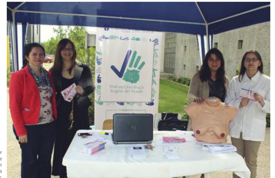
Stand presentado por académicas de la Escuela de Enfermería en el campus San Miguel en el marco de la semana internacional del cáncer.