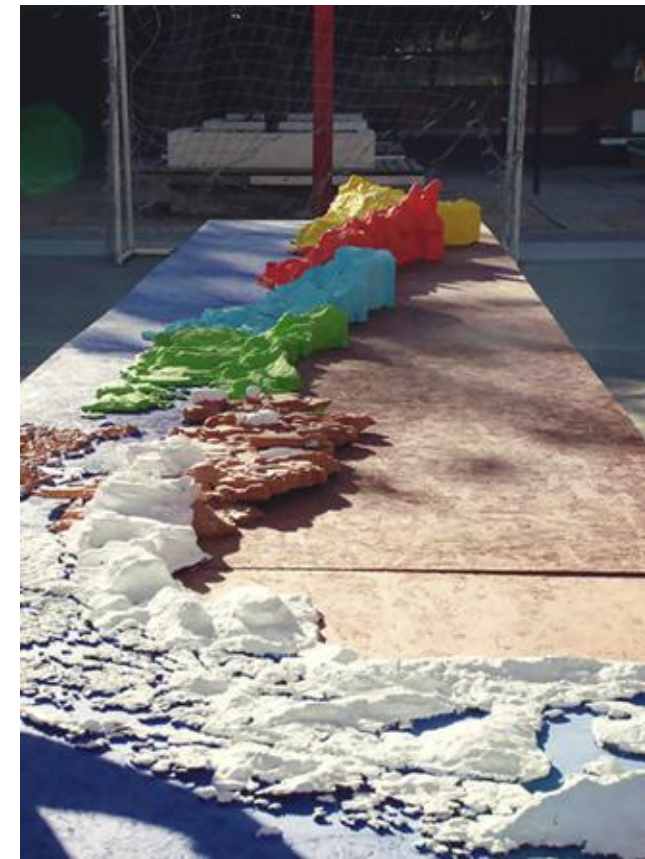
Mapa a escala de 8 metros de largo, que incluye las 15 regiones de Chile, desarrollado por estudiantes de Pedagogía Básica con mención, del campus Curicó