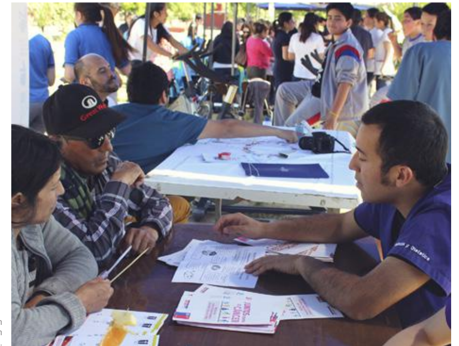
Atenciones preventivas en todas las áreas ofrece el PMI en Oncología a la comunidad.