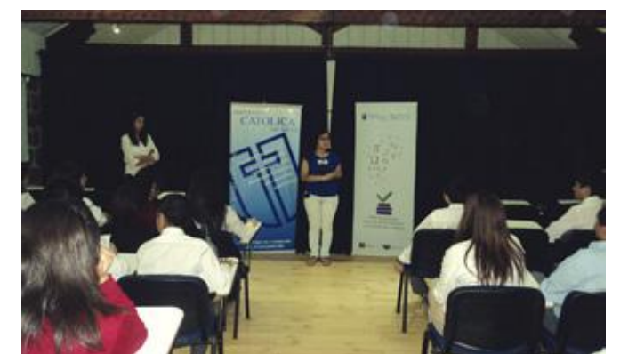
Exposición de socialización de las Pedagogías