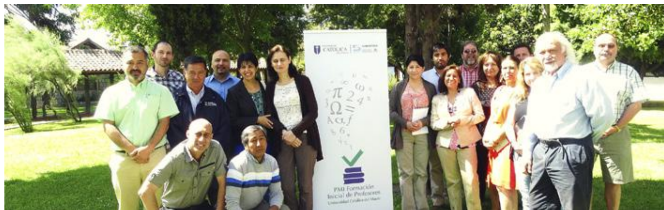
Fortaleciendo el Cuerpo Académico formador de Profesores UCM

Implementar un programa de fortalecimiento del cuerpo académico de la UCM formador de profesores, acorde al nuevo modelo formativo de docentes para el sistema escolar.