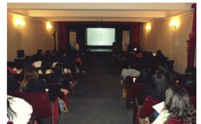
Asistentes al encuentro