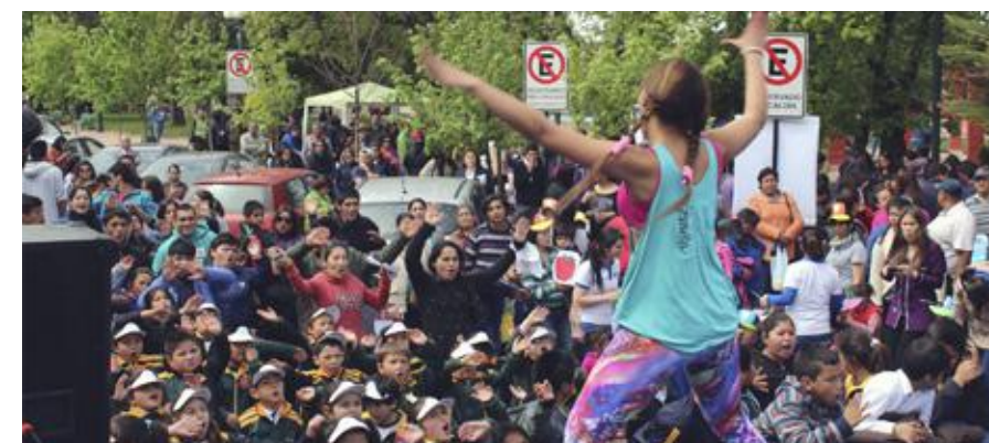
La zumba como actividad deportiva que moviliza a todas las edades.