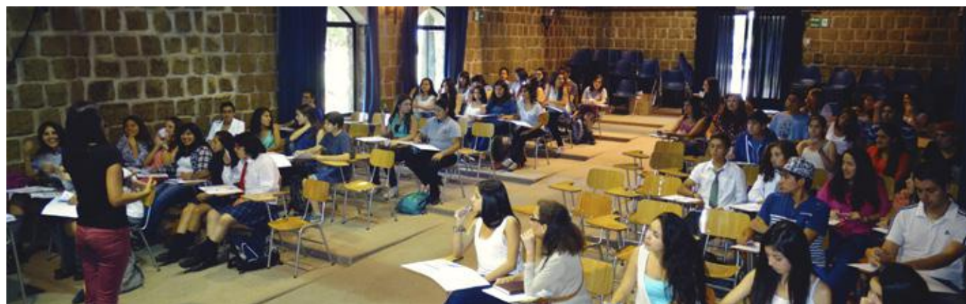
Segundo Taller Motivacional Programa de Atracción de Talentos en Pedagogía

Aumentar la calidad académica de los estudiantes que ingresan a las carreras pedagógicas de la UCM promoviendo con ello la retención de los mismos.