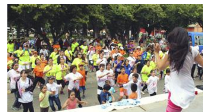
Vuelta a la calma luego de la corrida familiar Lontué-Molina.