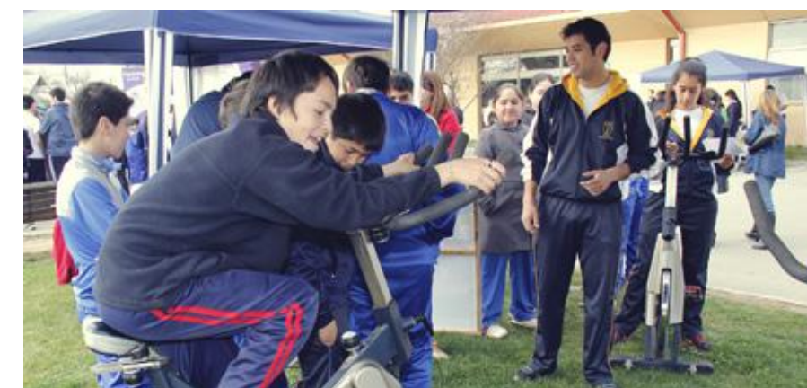
Spinning, como una de las actividades deportivas principales en el lanzamiento efectuado en la comuna de San Clemente.