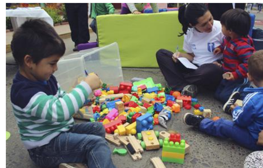
Niños disfrutan de las actividades preparadas por la Escuela de Educación física para las actividades comunitarias del PMI en Oncología.