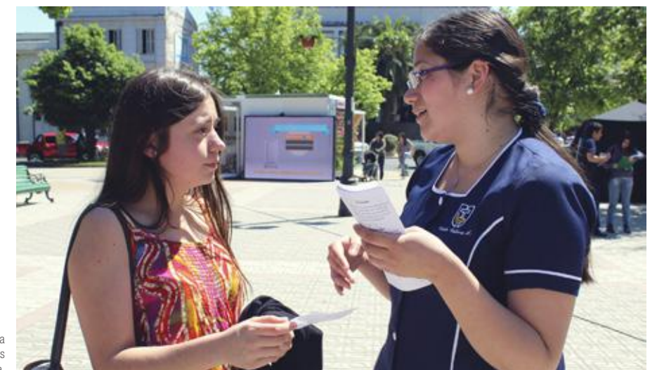
Entrega de información a transeúntes en Plaza de Armas de Talca.