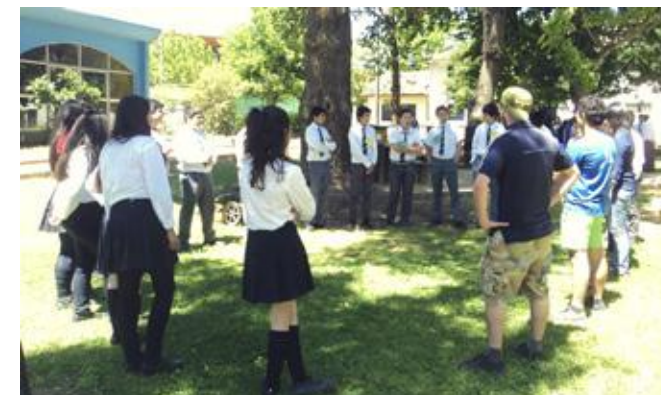
Alumnos de la Escuela Camilo Henríquez, dando inicio a la Actividad