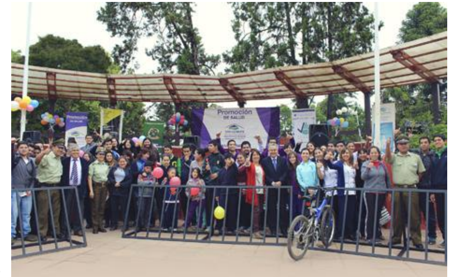
Autoridades e invitados al "Masivo de actividad física en San Clemente"