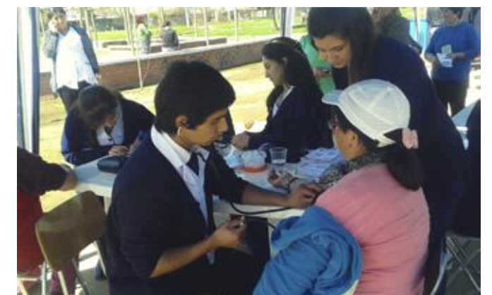
Alumnos Escuela de Enfermería realizaron acciones preventivas y educativas.