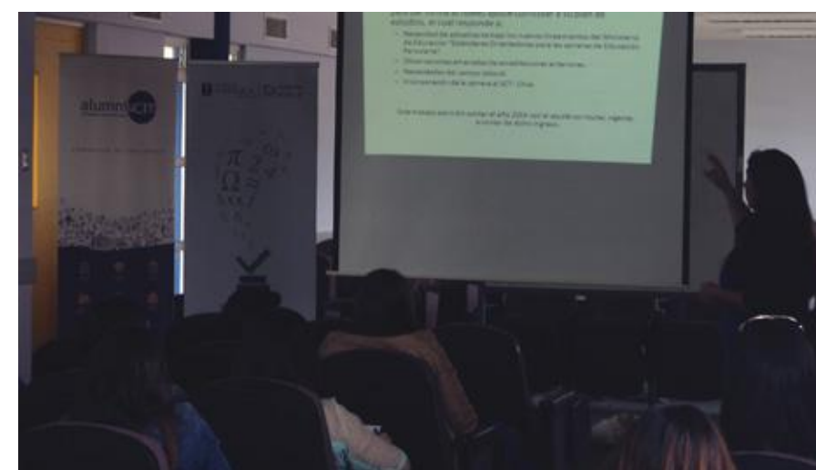
Análisis plan de mejora, escuela de Educación Parvularia