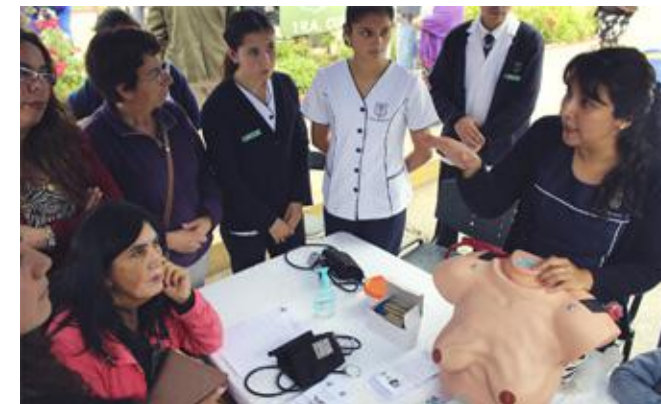
Educación en la detección precoz del cáncer de mamas.