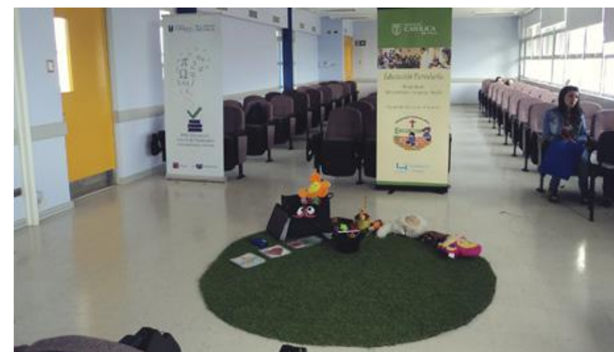
Montaje taller práctico encuentro Ex Alumnos