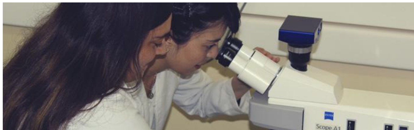
Investigadoras del Laboratorio de Investigaciones Biomédicas, integrantes del PMI en Oncología.

Fortalecer la complejidad de la investigación en cáncer para incrementar los indicadores de investigación oncológica traslacional y la atracción de capital humano para el área en la región.