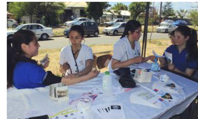
Evaluación de presión arterial y consejos para una mejor calidad de vida entregados por alumnas de la Escuela de Enfermería.