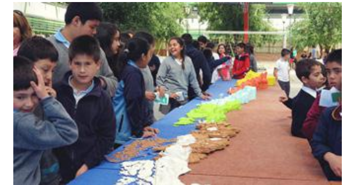
Alumnos de la comuna que asisten a la exposición