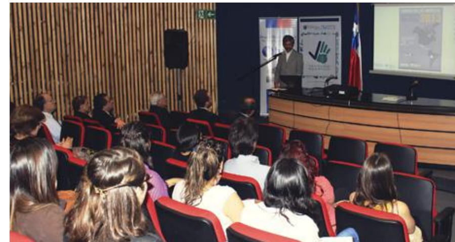
Jornada académica cáncer gástrico, semana mundial prevención del cáncer 2014.