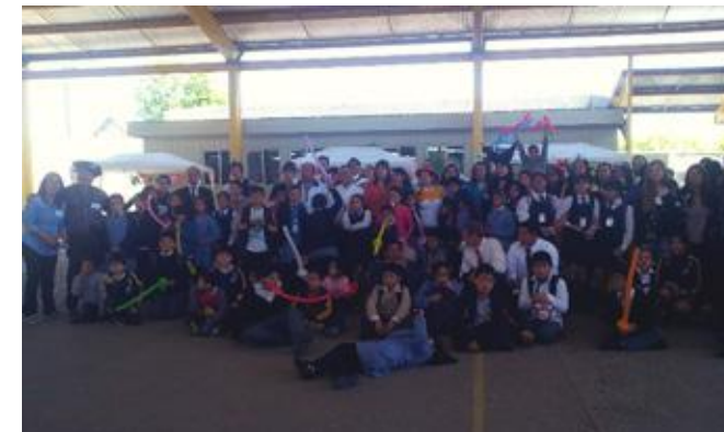
Alumnos Escuela Brilla el Sol