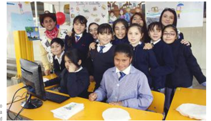
Stand alimentación saludable y no saludable, acompañadas del profesor a cargo de la actividad