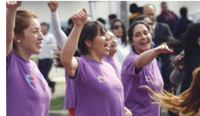
Entusiastas participantes de las actividades deportivas en la ceremonia de lanzamiento.