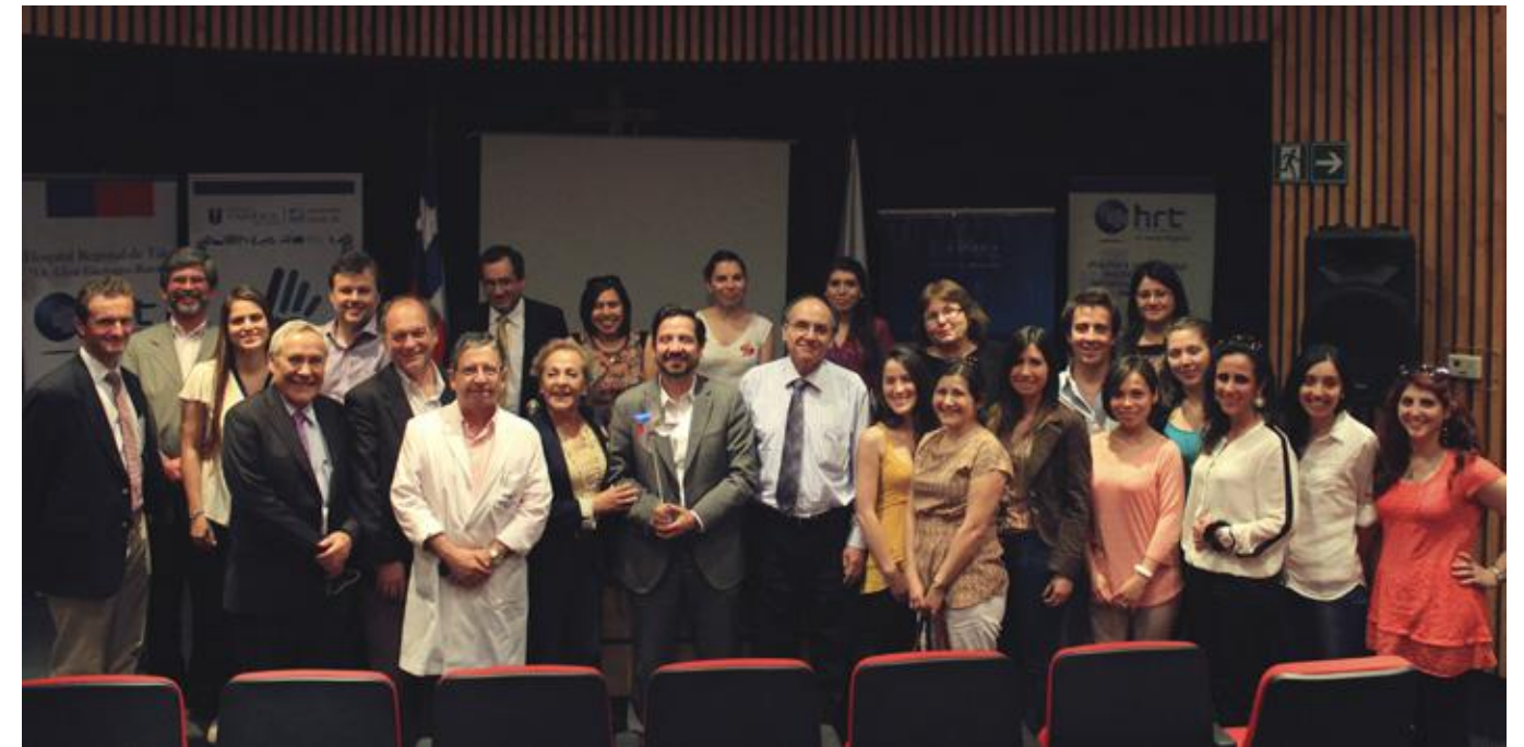
Expositores y participantes "Jornada actualización tumores digestivos"