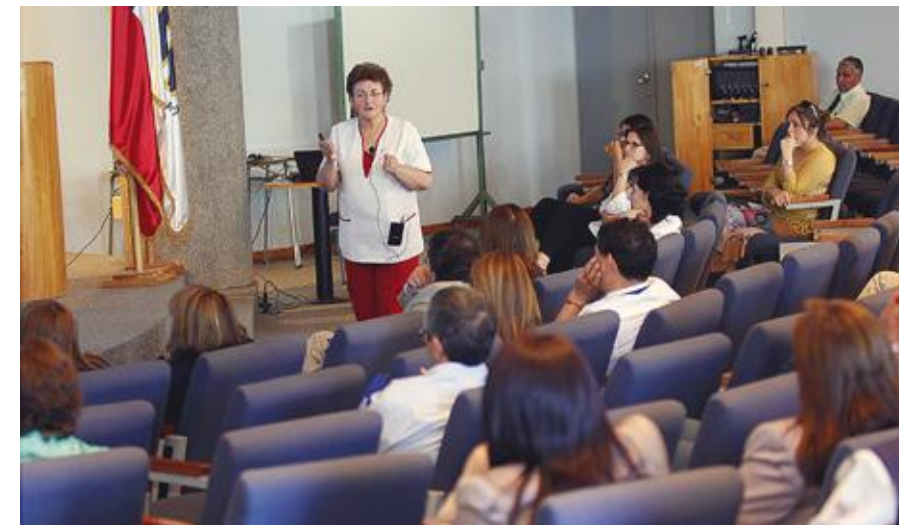
Prevención en cáncer de mamas, cervico uterino y de próstata entre las temáticas abordadas.