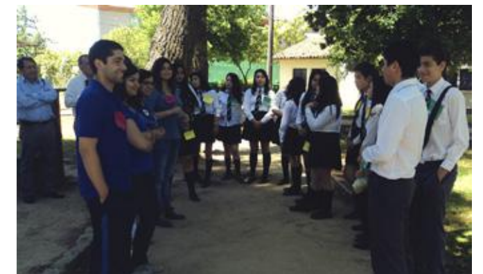
Alumnos de Pedagogía en Inglés, conformación de los grupos