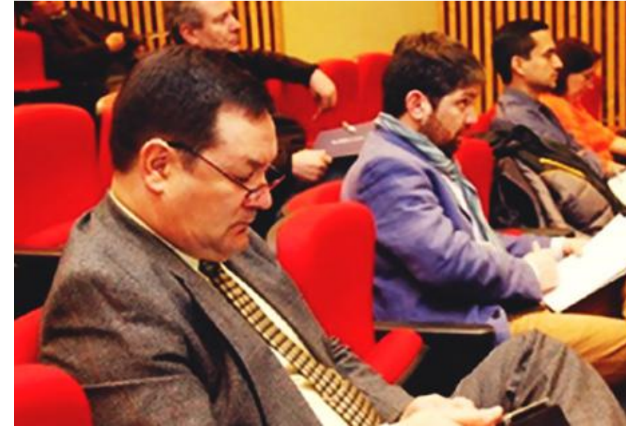
Médicos y profesionales asistentes a la Jornada de cáncer de mamas.