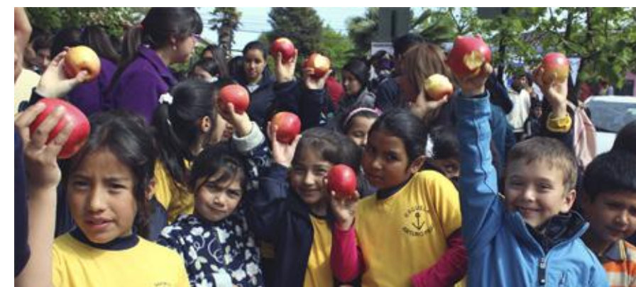
Niños participantes de la feria de alimentación Saludable organizada en San Clemente con el apoyo del PMI en Oncología.