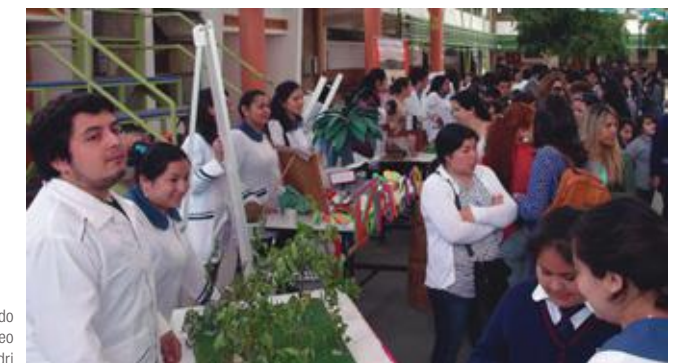
Comunidad de Romeral, visitando la exposición realizada en el Liceo Arturo Alessandri