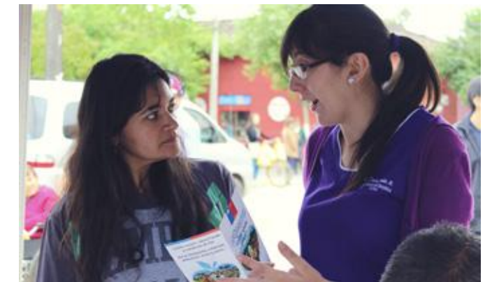
Escuela de Nutrición y Dietética en difusión de conductas saludables para la prevención del cáncer.