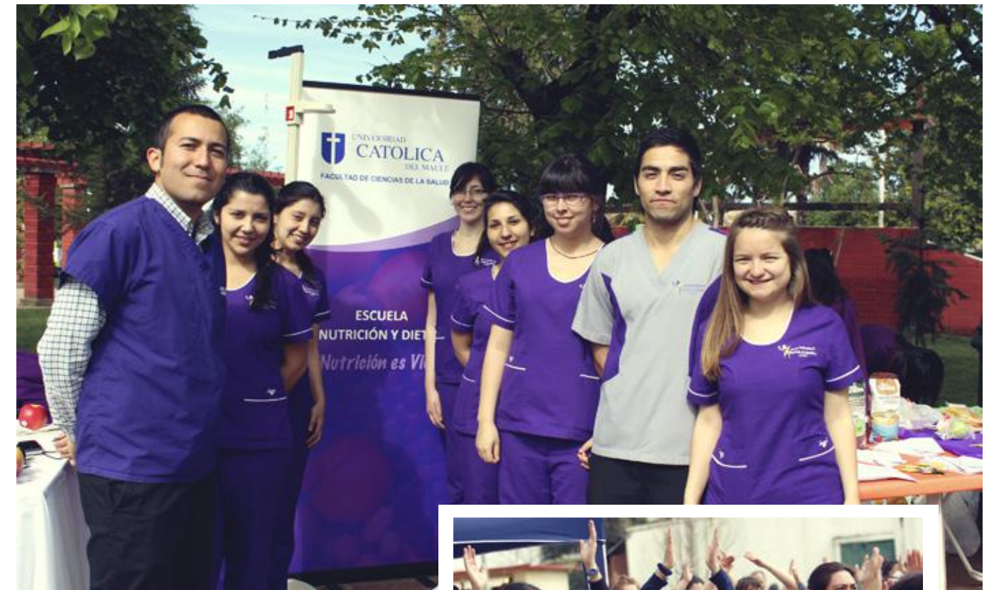
Integrantes de la Escuela de Nutrición y Dietética de la Facultad de Ciencias de la Salud.