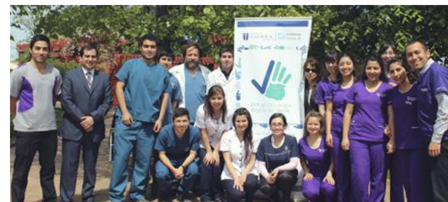
Equipo PMI en Oncología presente en el "Día Mundial de la Alimentación" en San Clemente.