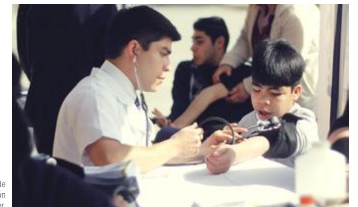
Prevención de factores de riesgo y educación en detección precoz del cáncer.