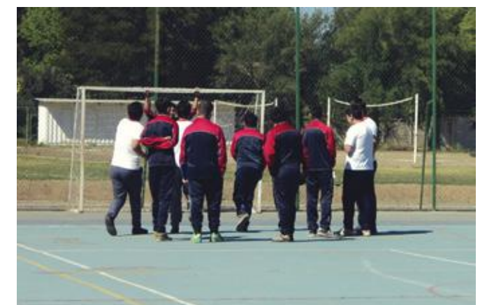
Inicio partido de baby - futbol