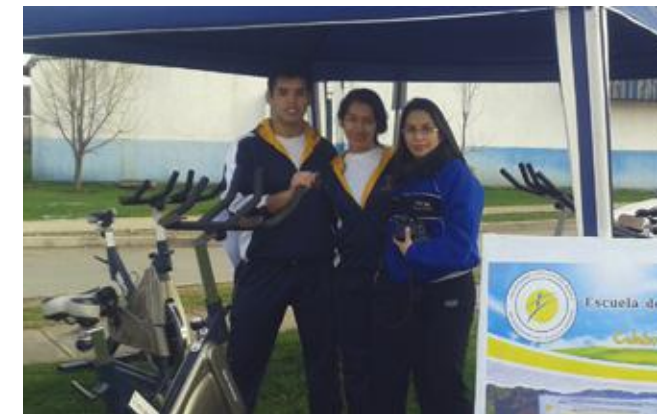
Las acciones comunitarias desarrolladas incorporan actividades con participación de personas de todas las edades.