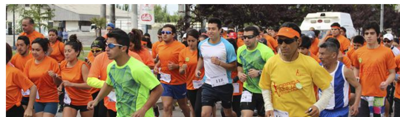
Más de 500 participantes reunió la corrida Familiar Lontué-Molina en noviembre de 2014.