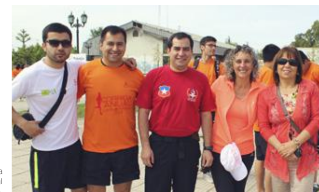
Autoridades de la UC del Maule junto a la Alcaldesa y representantes de la Municipalidad de Molina al inicio de la corrida familiar Lontué-Molina 2015.