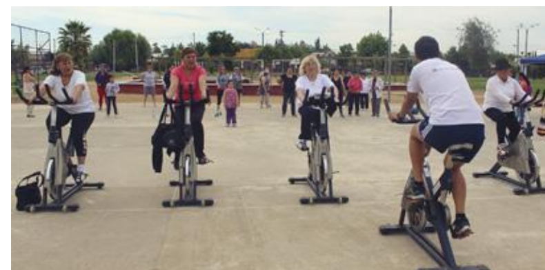
Spinning entre las iniciativas ofrecidas por la Escuela de Educación Física.