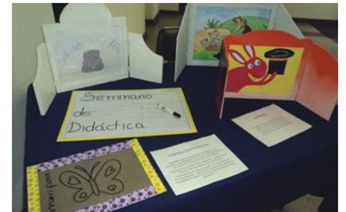
Material didáctico preparado por alumnos de la carrera