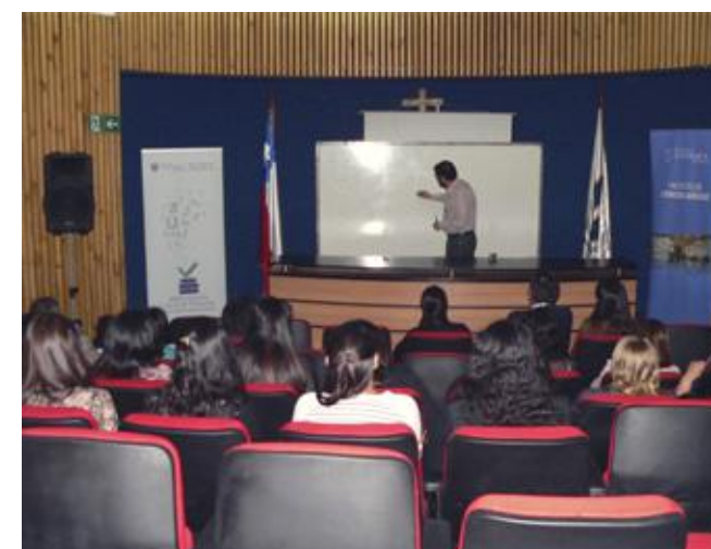
Charla expositiva dirigida a alumnos y egresados de la Escuela de Pedagogía en Ciencias