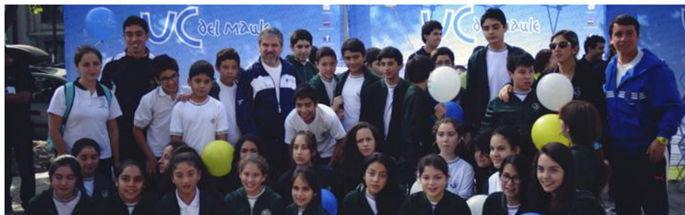
Rector UCM, Dr. Diego Durán Jara, en actividad de vinculación con el sistema escolar regional

Vincular estrechamente el proyecto formativo de profesores UCM con el sistema educacional para lograr redes de trabajo que hagan posible mejorar la formación de profesores y elevar los niveles de aprendizajes de los alumnos del sistema escolar, particularmente de sectores más vulnerables.