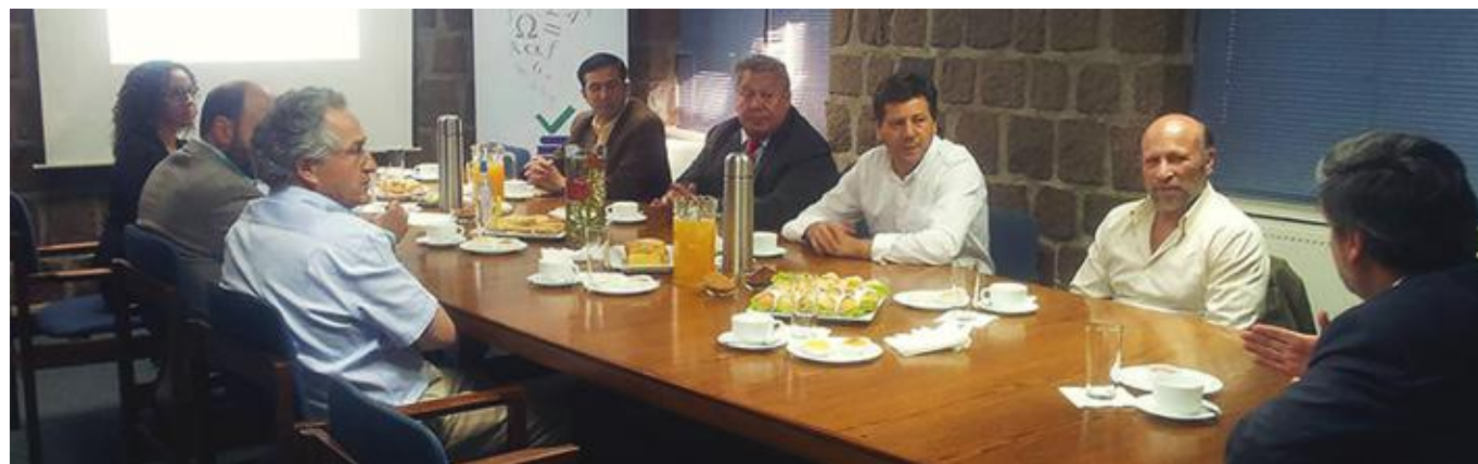
Mesa de trabajo interinstitucional

Diseñar e implementar un modelo de gestión, que involucre aliados nacionales, regionales e internacionales, fortaleciendo la implementación y sustentabilidad en el tiempo del PMI.