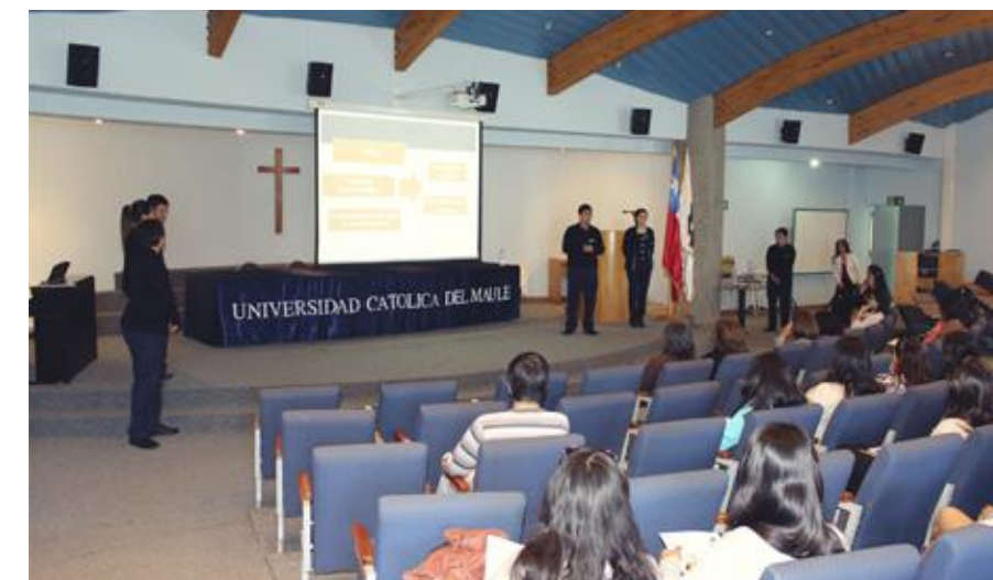
Investigación en conductas preventivas en cáncer en el Liceo abate Molina de Talca, fue el tema presentado por alumnos de la Escuela de enfermería.