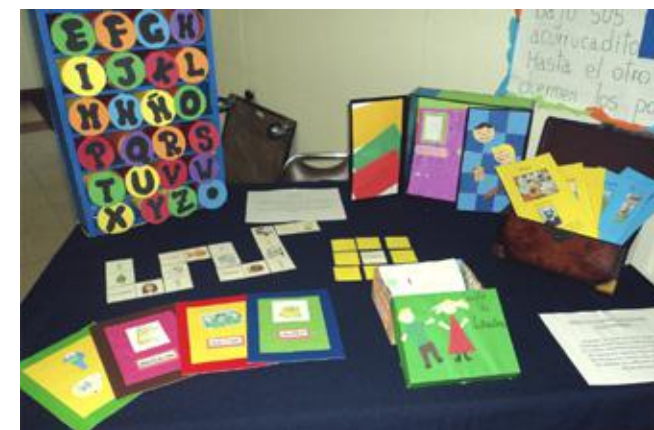
Material didáctico preparado por alumnos de la carrera