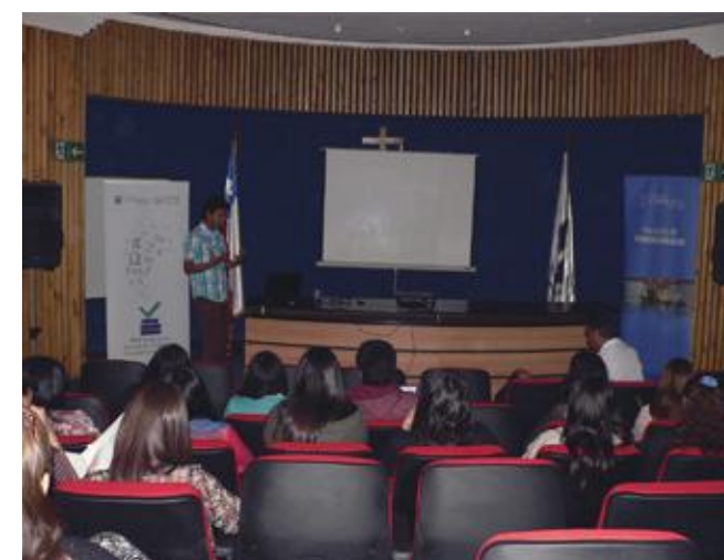
Exposición para el fortalecimiento de los docentes del área de las ciencias