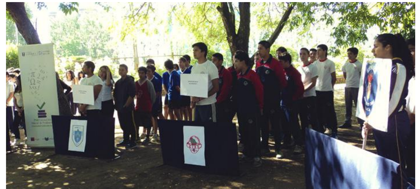
Ceremonia de inicio de la actividad