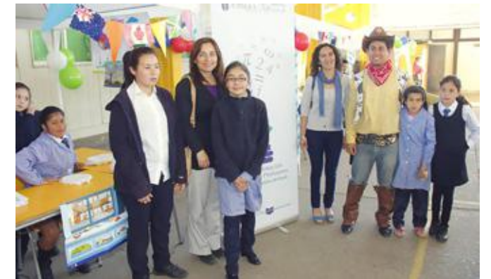
Equipo PMI junto a alumnas y profesor a cargo de la actividad