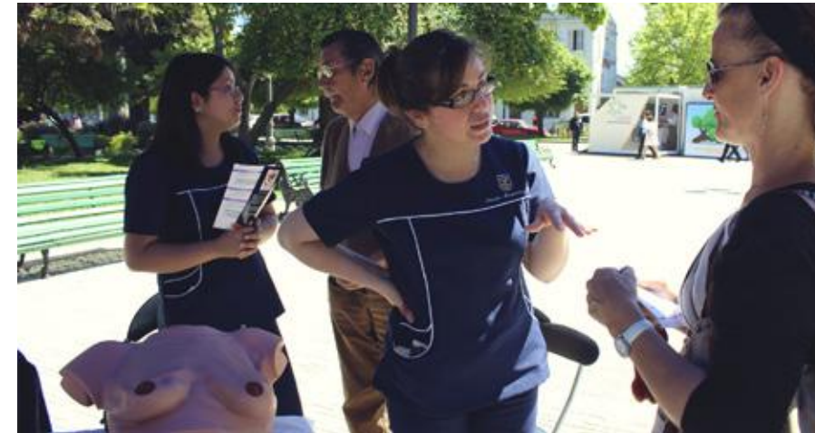
Acciones de prevención con la comunidad en la Plaza de Armas de Talca.

“Desarrollar un modelo integral y replicable que permita abordar la promoción, prevención y control del cáncer en comunidades de la región, mediante la articulación de una red de actores públicos, privados y sociales del desarrollo local del Maule, el cual al mismo tiempo promueva el fortalecimiento de las capacidades individuales y colectivas de las instituciones participantes del PMI para contribuir a la resolución de los problemas oncológicos de la población”