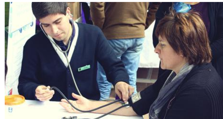
Atención preventiva en la celebración del Día Mundial de la Alimentación Saludable.