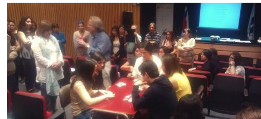
Docentes del sistema escolar participando del taller práctico