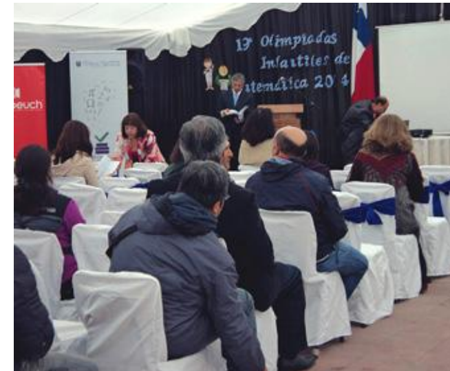
Ceremonia de inicio Olimpiadas, realizadas en la Escuela Carlos Salinas Lagos