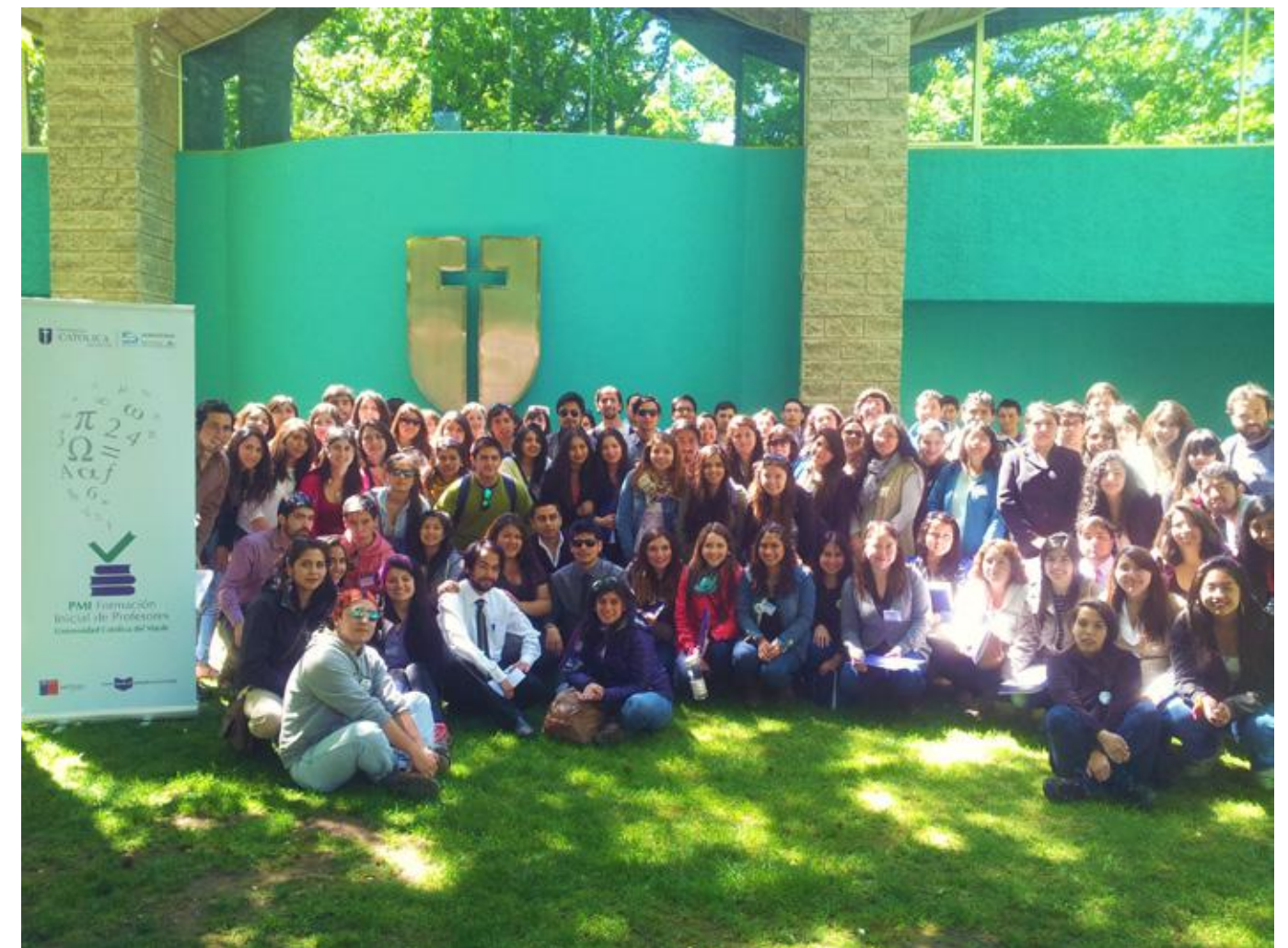
Alumnos de diversas universidades del país asistentes al encuentro