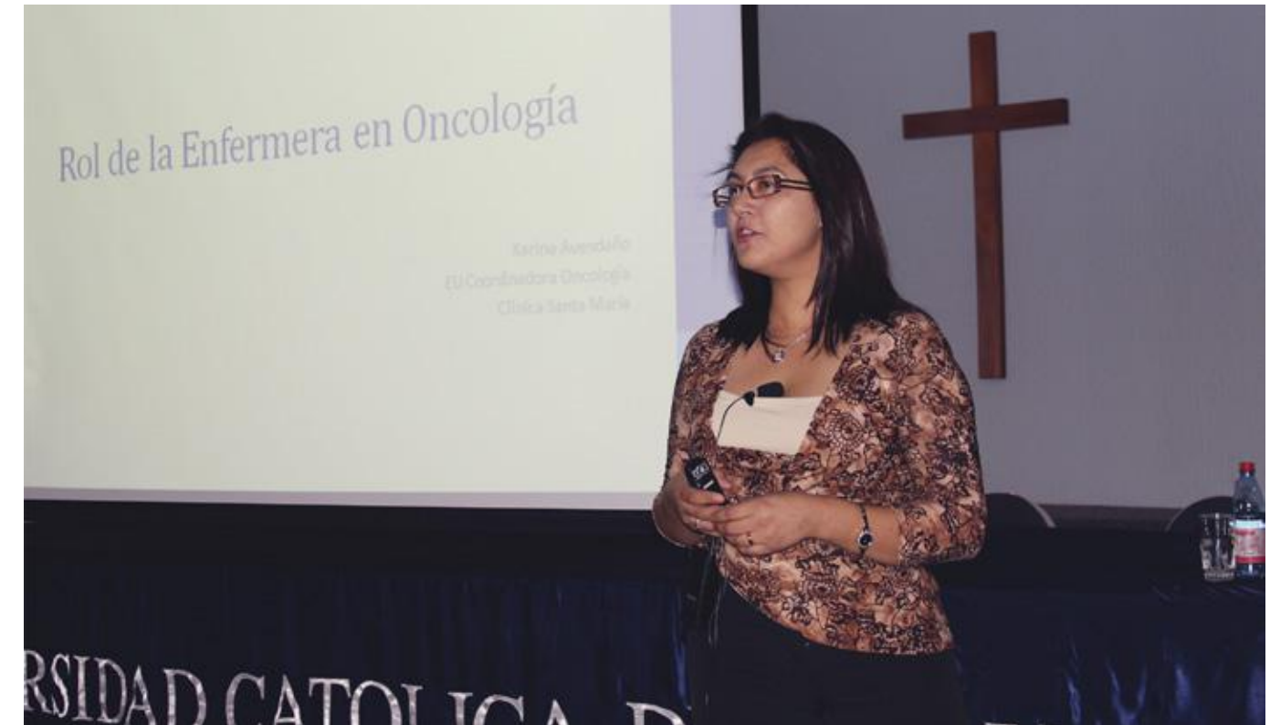
Académicos y alumnos se reunieron para conocer los trabajos desarrollados en Investigación por estudiantes de enfermería.