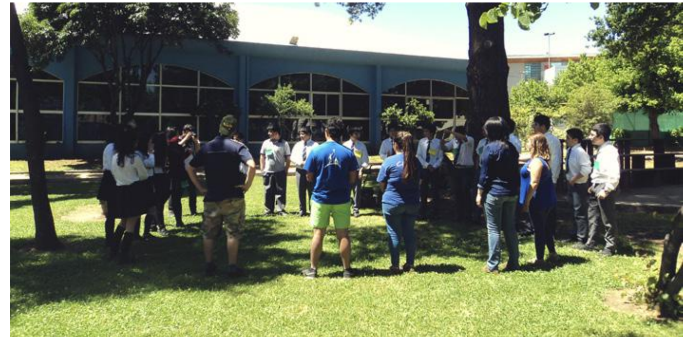
Alumnos de la Escuela Camilo Henríquez, dando inicio a la Actividad