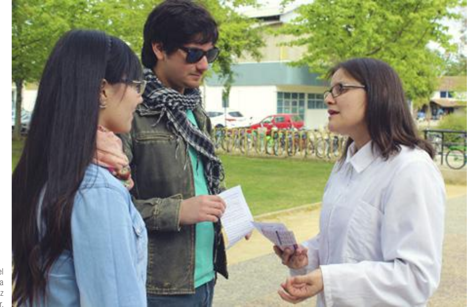
En el campus San Miguel entrega de información sobre la prevención y diagnóstico precoz del cáncer.