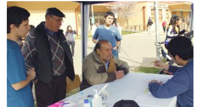
Alumnos Escuela de Kinesiología UC del Maule.