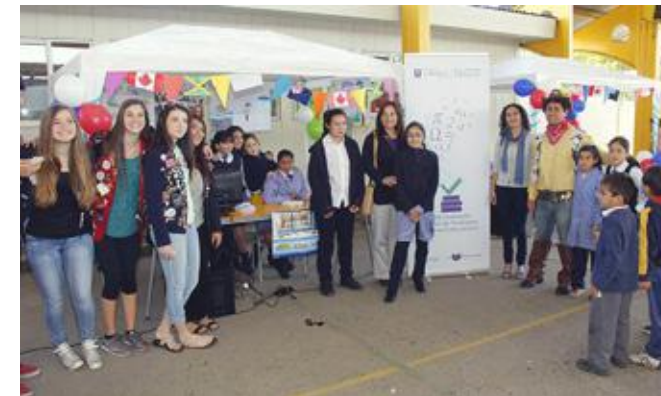
Visitantes a la feria