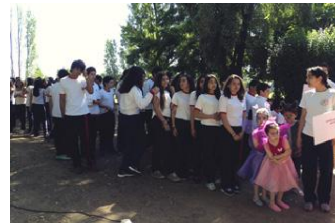
Alumnos del sistema escolar, invitados a participar del encuentro