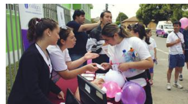
Académicas de la Escuela de Enfermería Curicó educando en la prevención del cáncer Cérvico Uterino.