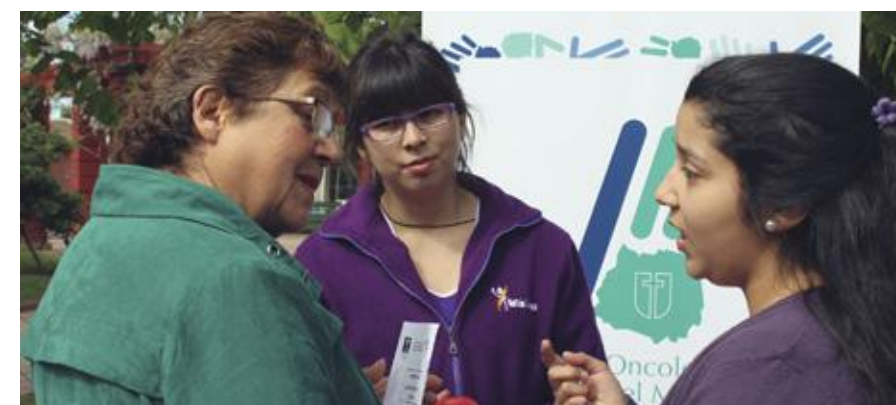
Alumnas de la Escuela de Nutrición y Dietética de Curicó.