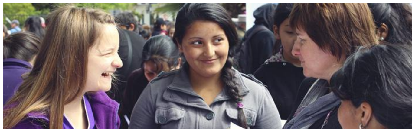
La interacción con la comunidad acerca la vida académica a las comunas de la región.

Fortalecer la promoción y prevención de cáncer en la población, así como el acompañamiento al paciente desde el diagnóstico.