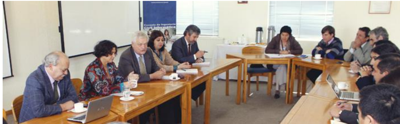
Mesa de trabajo interinstitucional para la instalación del PMI en Oncología, UC del Maule.