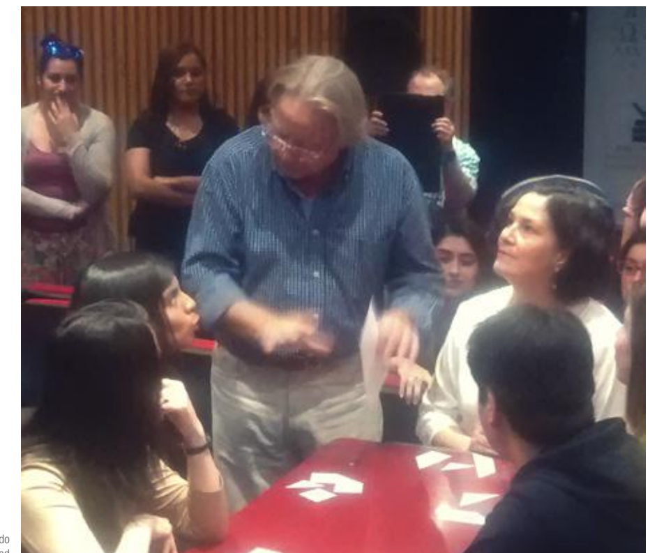
Profesores participando de la actividad