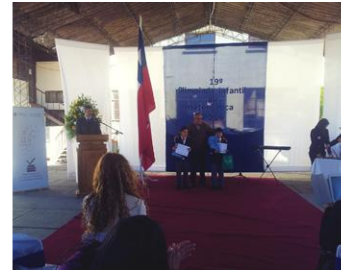
Ceremonia de premiación, entrega de premios