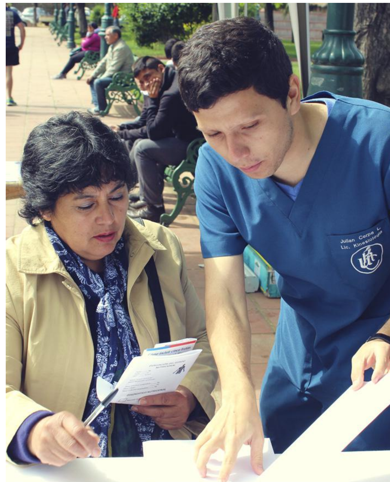
Alumno Escuela de Kinesiología UC del Maule.