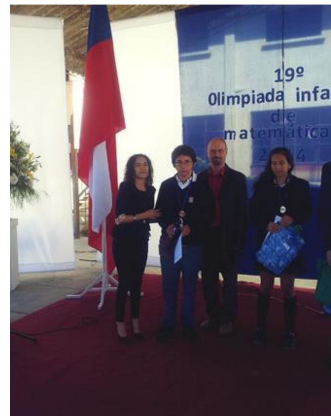
Ceremonia de premiación, entrega de premio por parte del PMI en Formación Inicial de Profesores