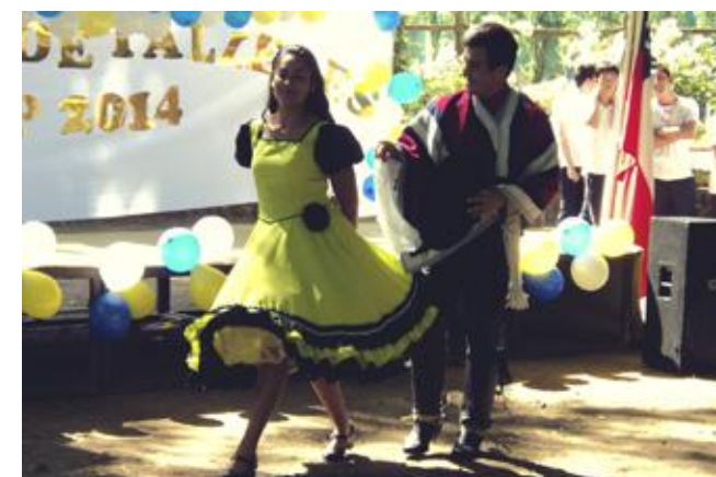
Presentación baile Nacional, Alumnos de Pedagogía en Educación Física