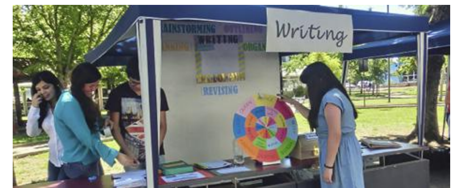
Stand de alumnos de pedagogía, fuera de la Facultad de Ciencias de la Educación